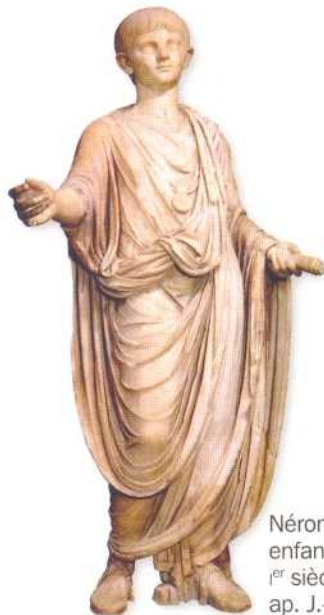
Néron enfant, I er siècle ap. J.-C.

6 Repères : les personnages et les grandes dates du règne